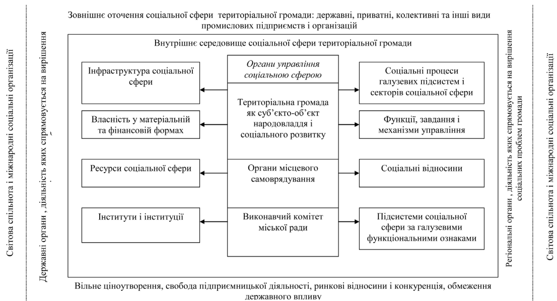
Рис. 1. Основні складові і елементи архітекτονіки соціальної сфери територіальної громади як ланки суспільства