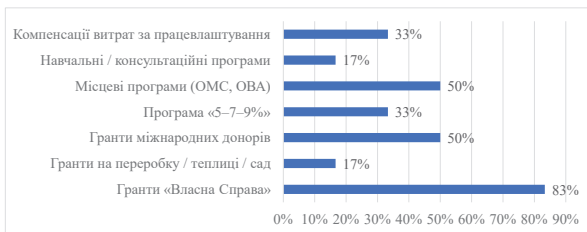
Рис. 3 Інструменти підтримки, які використовували під час війни

Важливим прийомом оцінки державної підтримки МСП щодо різноманітних інструментів підтримки складає, за результатами опитування респондентів, розподіл вибору та частоти їх використання в умовах прифронтової території (рис.3).