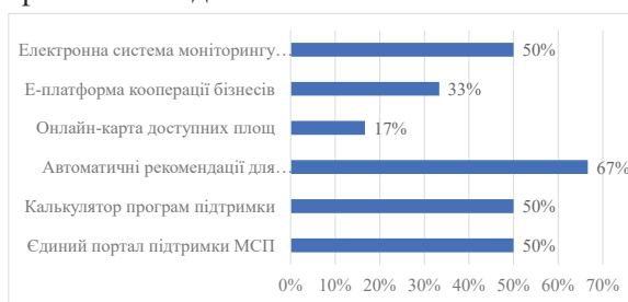
Рис. 5. Цифрові інструменти які потрібно додати

Окремо респонденти наголосили на критичній потребі у цифрових сервісах, які могли б спростити доступ до інформації, програм підтримки та процедур подання заявок (рис. 5). В умовах цифровізації економіки зростає роль цифрових та інтелектуальних ресурсів, зокрема рішень на основі штучного інтелекту, як чинника конкурентоспроможності бізнесу. Попри обмежені фінансові та кадрові ресурси МСП для масштабного впровадження цифрових і AI-технологій, підприємці мають можливість використовувати доступні інноваційні продукти та нішеві технологічні рішення для підвищення ефективності діяльності.