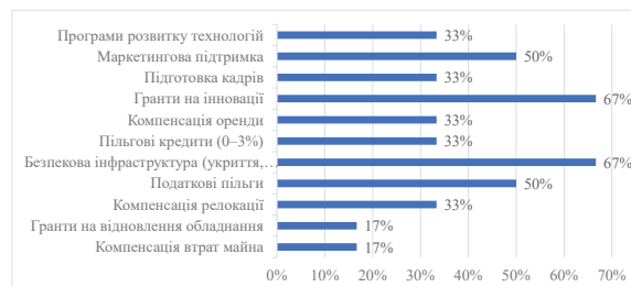
Рис. 4 Інструменти підтримки, яких бракує респондентам

З точки зору розробки державних стратегій і програм підтримки МСП важливий є рейтинг найбільш затребуваних інструментів, на які усталено формується попит підприємців. Так, за результатами опитування респондентів (рис. 4), бізнесу бракує саме комплексних інструментів, пов'язаних з енергетичною безпекою, технологічним оновленням та маркетинговим просуванням, що свідчить про необхідність розширення регіональної політики підтримки в напрямку інфраструктурних та інноваційних рішень.